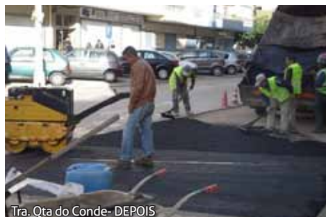
Tra. Qta do Conde- DEPOIS