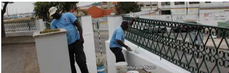
Pintura de Muros