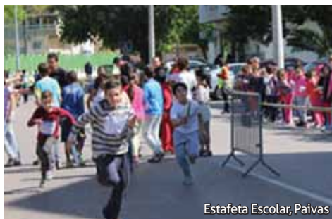
Estafeta Escolar, Paivas

São ainda promovidas diversas iniciativas que envolvem muitos milhares de crianças, como o Desfile de Carnaval, a Estafeta Escolar, o Dia Mundial da Criança e o passeio em Barco Dragão.