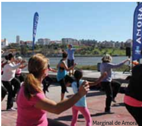
Marginal de Amora

A Junta de Freguesia de Amora assinalou o Dia Internacional da Mulher, que se comemora a 8 de março, com uma série de iniciativas para homenagear o empenho e a luta de muitas gerações de mulheres pelos seus direitos, mas também para denunciar e combater as discriminações e desigualdades que ainda subsistem na nossa sociedade e no mundo. Logo pela manhã, enquanto decorria uma aula de body combat junto à Zona Ribeirinha, o Executivo da Junta de Freguesia distribuiu flores a todas as mulheres que por ali passavam, umas participando nas atividades desportivas, outras apreciando as condições climatéricas que embelezam, ainda mais, esta parte nobre da Freguesia.