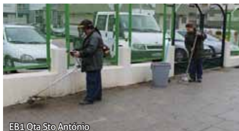
EB1 Qta Sto António