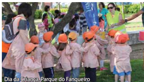
Dia da Criança, Parque do Fanheiro