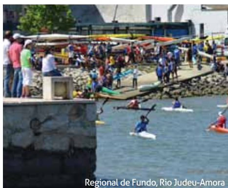
Regional de Fundo, Rio Judeu-Amora

No II Triatlo Jovem de Amora , que se realizou no dia 26 de abril, prova a contar para o Campeonato Nacional Jovem de Clubes, que incluiu uma Prova Aberta a todos os interessados, participaram 435 atletas. A iniciativa - que decorreu na Zona Ribeirinha, espaço que acolheu, pelo segundo ano consecutivo, o Triatlo Jovem de Amora - foi organizada pela Associação Naval Amorense, Junta de Freguesia de Amora e Câmara Municipal do Seixal, com o apoio da Federação de Triatlo de Portugal.