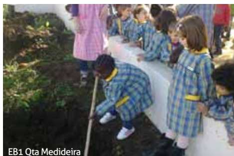
EB1 Qta Medideira