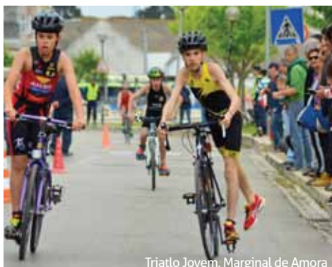
Triatlo Jovem, Marginal de Amora

Em ambos os momentos, os atletas, acompanhados pelas suas famílias e amigos, deslumbraram-se com esta terra, de gente que gosta de receber, que cada vez tem melhores condições para a prática desportiva e para acolher grandes eventos.