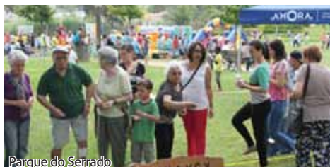
Parque do Serrado