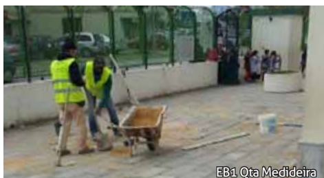
EB1 Qta Medideira