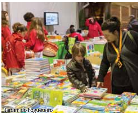
Jardim do Fogueteiro

O Jardim do Fogueteiro voltou a acolher, de 4 a 27 de abril, a 9.ª Feira do Livro, uma iniciativa promovida pela Junta de Freguesia de Amora, Câmara Municipal do Seixal e Página a Página – Divulgação do Livro SA. Durante 23 dias, para além do visionamento de um filme sobre os 40 anos do 25 de Abril, os visitantes deste espaço tiveram a oportunidade de adquirir livros de vários géneros aos melhores preços, encontros com escritores, atividades educativas e culturais e passatempos com oferta de livros. A inauguração, no dia 4 de abril, contou com a atuação dos Tocá Rufar.