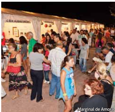
Marginal de Amora