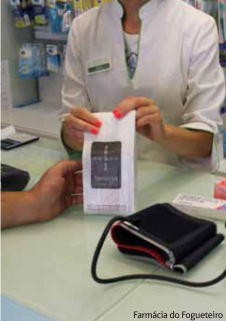
Farmácia do Fogueteiro