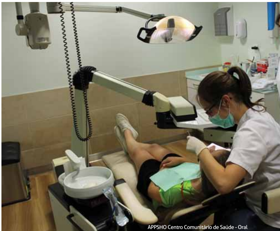
APPSHO Centro Comunitário de Saúde - Oral