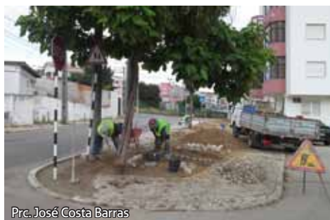
Pra. José Costa Barras

Na Rua Carlos Costa Lima, na Avenida Marcos Portugal e na Praceta José Costa Barras já terminaram as obras de requalificação destas artérias, que incluíram a execução de novos passeios, a beneficiação da calçada existente, o rebaixamento dos passeios nas passeadeiras e a desmatização da área envolvente.