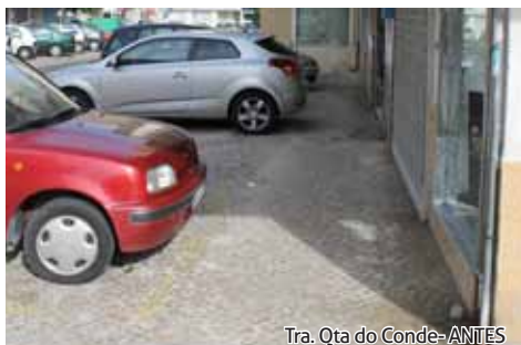
Tra. Qta do Conde-ANTES

trabalhadores desta autarquia ou por adjudicação, muitas a pedido das populações, que vão desde a colocação de pilaretes, assentamento de calçada ou lajeta, rebaixamento de lancil e lajeta junto a passadeiras, construção de rampas para pessoas com deficiência, colocação de alcatrão em pavimentos