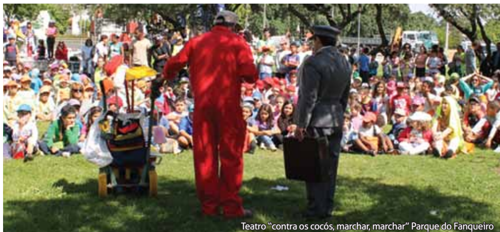
Teatro "contra os cocós, marchar, marchar" Parque do Fanqueiro