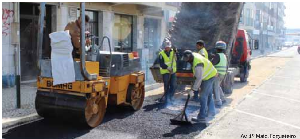
Av. 1º Maio. Fogueteiro