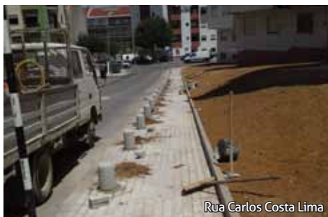
Rua Carlos Costa Lima