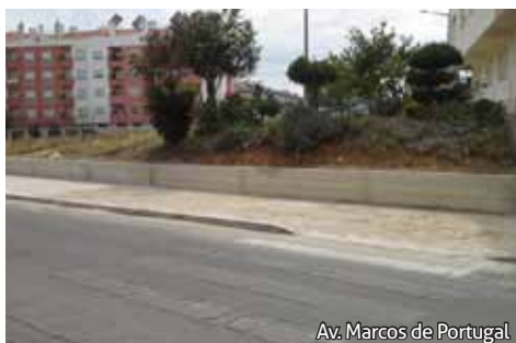
Av. Marcos de Portugal