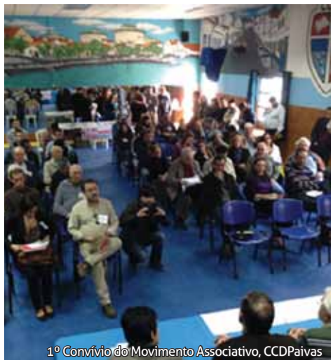
1º Convívio do Movimento Associativo, CCDPaivas