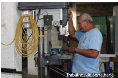
Trabalhos de Serralharia