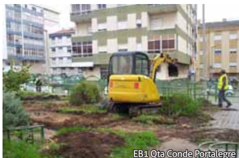
EB1 Qta Conde Portalegre