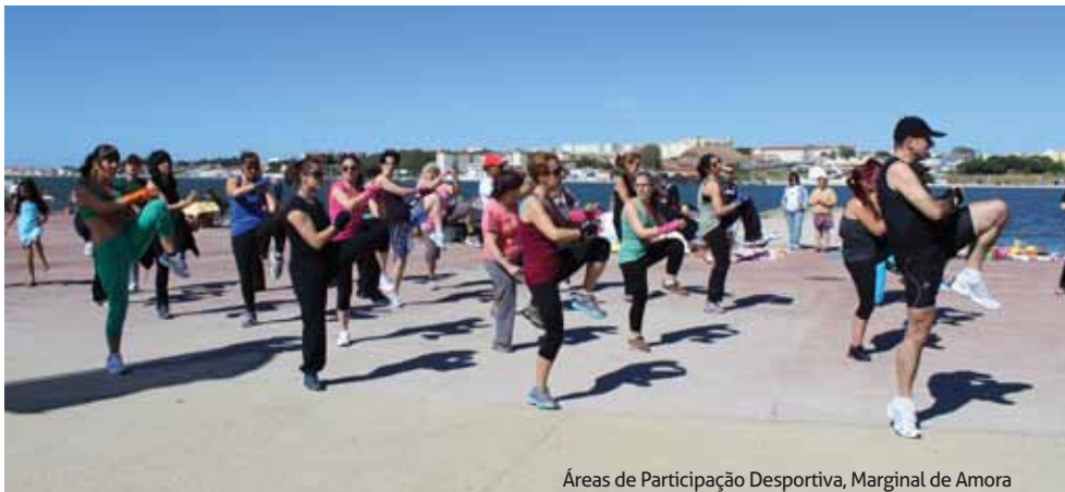
Áreas de Participação Desportiva, Marginal de Amora