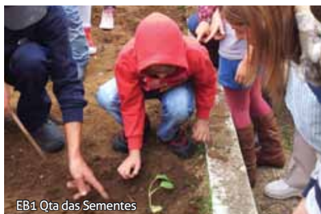
EB1 Qta das Sementes

De forma lúdica ensina-se o percurso dos alimentos.