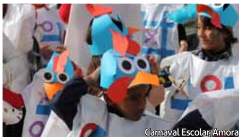
Carnaval Escolar, Amora