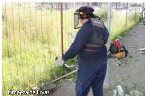
Limpeza de Ervas