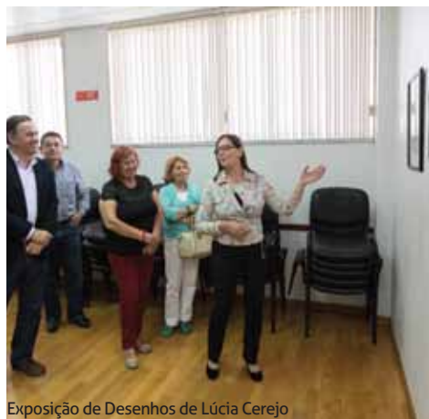
Exposição de Desenhos de Lúcia Cerejo