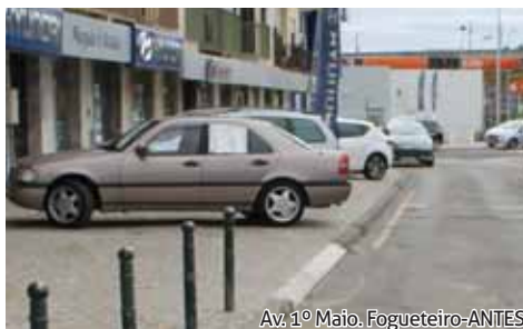
Av. 1º Maio, Fogueiteiro-ANTES