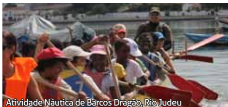
Atividade Náutica de Barcos Dragão, Rio Judeu

atribuição de subsídios para, entre muitos outros, os projetos finais do ano letivo e para aquisição de diversos materiais, como quadros de cortice, tintas para pintura de mural, fotocópias e festas de Natal e de abertura do ano escolar. Só em 2013 foram concedidos perto de seis mil euros.