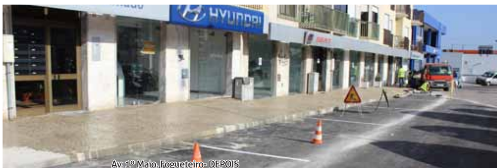
Av. 1º Maio, Fogueiteiro-DEPOIS

Dando cumprimento à execução do plano de atividades, foi feito o melhoramento do espaço público na zona da Av. primeiro de Maio no Fogueiteiro, a nível de pavimentação rodoviária e pedonal, drenagem de águas pluviais e estacionamento.