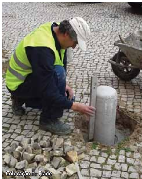
Colocação de Frade

«Mil e mais uma» competências que apenas têm como objetivo melhorar a vida das pessoas.